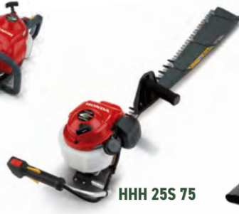
HHH 25S 75