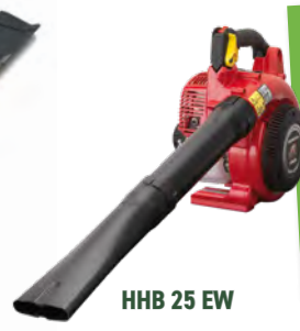
HHB 25 EW