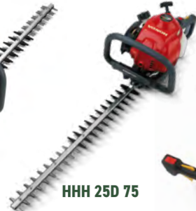
HHH 25D 75