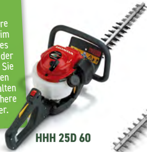
HHH 25D 60

Schneiden Sie Ihre Hecken zweimal im Jahr, am Ende des Wachstums oder der Blüte. Schneiden Sie präzise von unten nach oben und halten Sie die Heckenschere dicht am Körper.