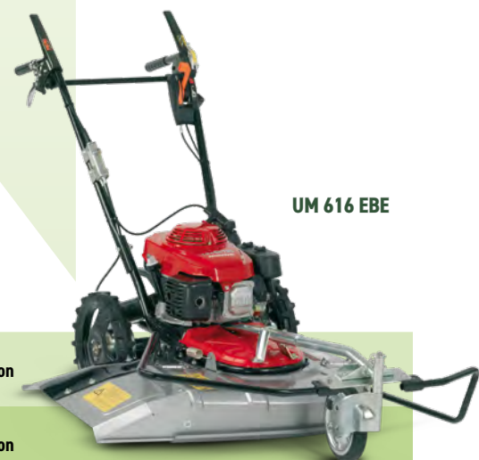
UM 616 EBE