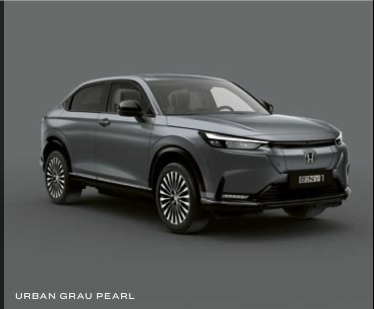
URBAN GRAU PEARL