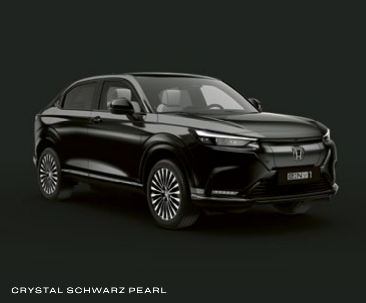
CRYSTAL SCHWARZ PEARL