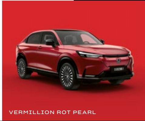
VERMILLION ROT PEARL