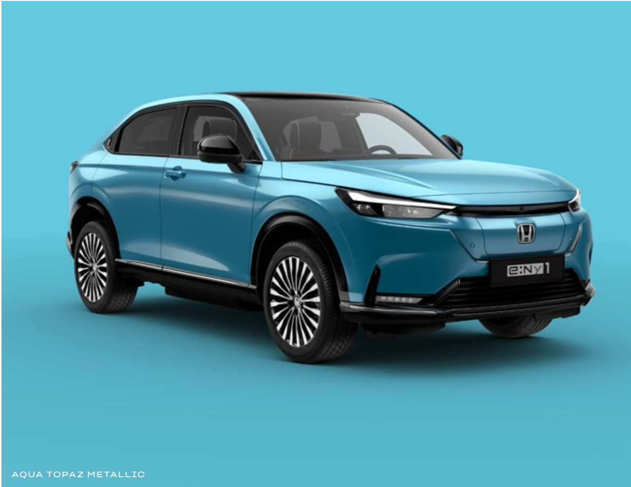
AQUA TOPAZ METALLIC

Wählen Sie aus einer Reihe aktueller Farben, die Ihre Individualität und das dynamische Design des e:Ny1 unterstreichen.