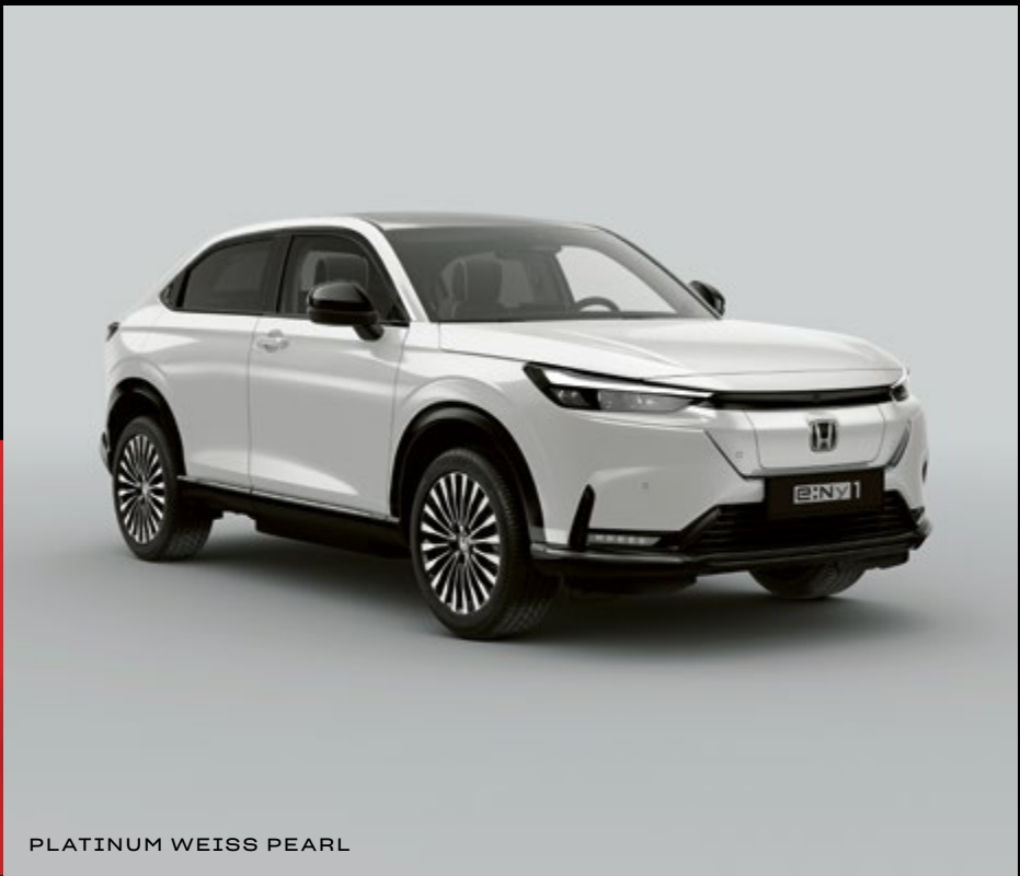
PLATINUM WEISS PEARL