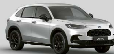
DIAMOND DUST PEARL