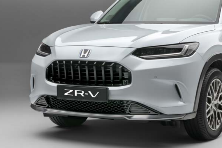
AERO-FRONTSTOSSFÄNGER Steigern Sie das dynamische Styling Ihres ZR-V mit unserem unverwechselbaren Aero-Frontstossfänger.