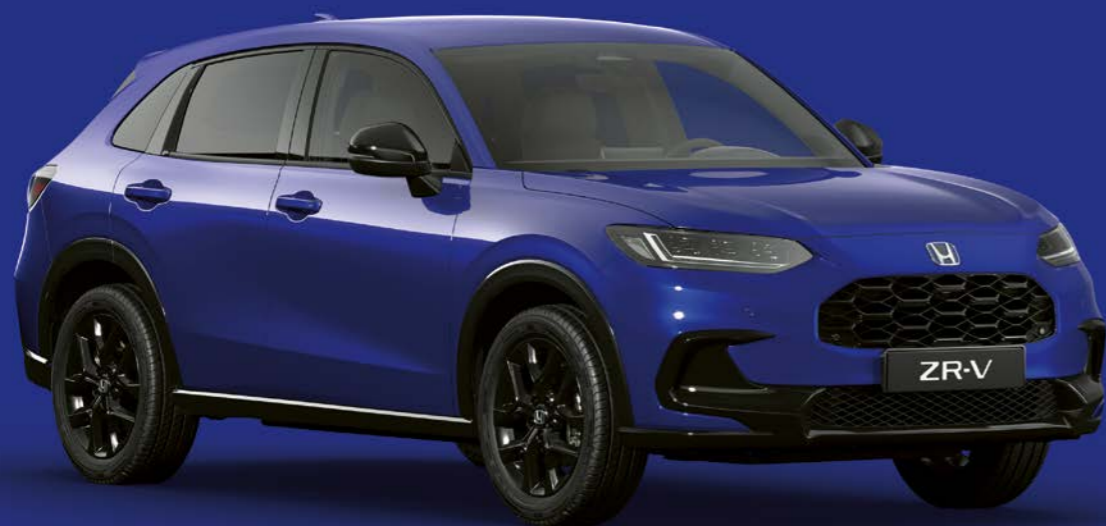
STILL NIGHT PEARL

Wählen Sie aus einer Reihe von modernen Farben, die Ihre Persönlichkeit und das dynamische Design des ZR-V unterstreichen.