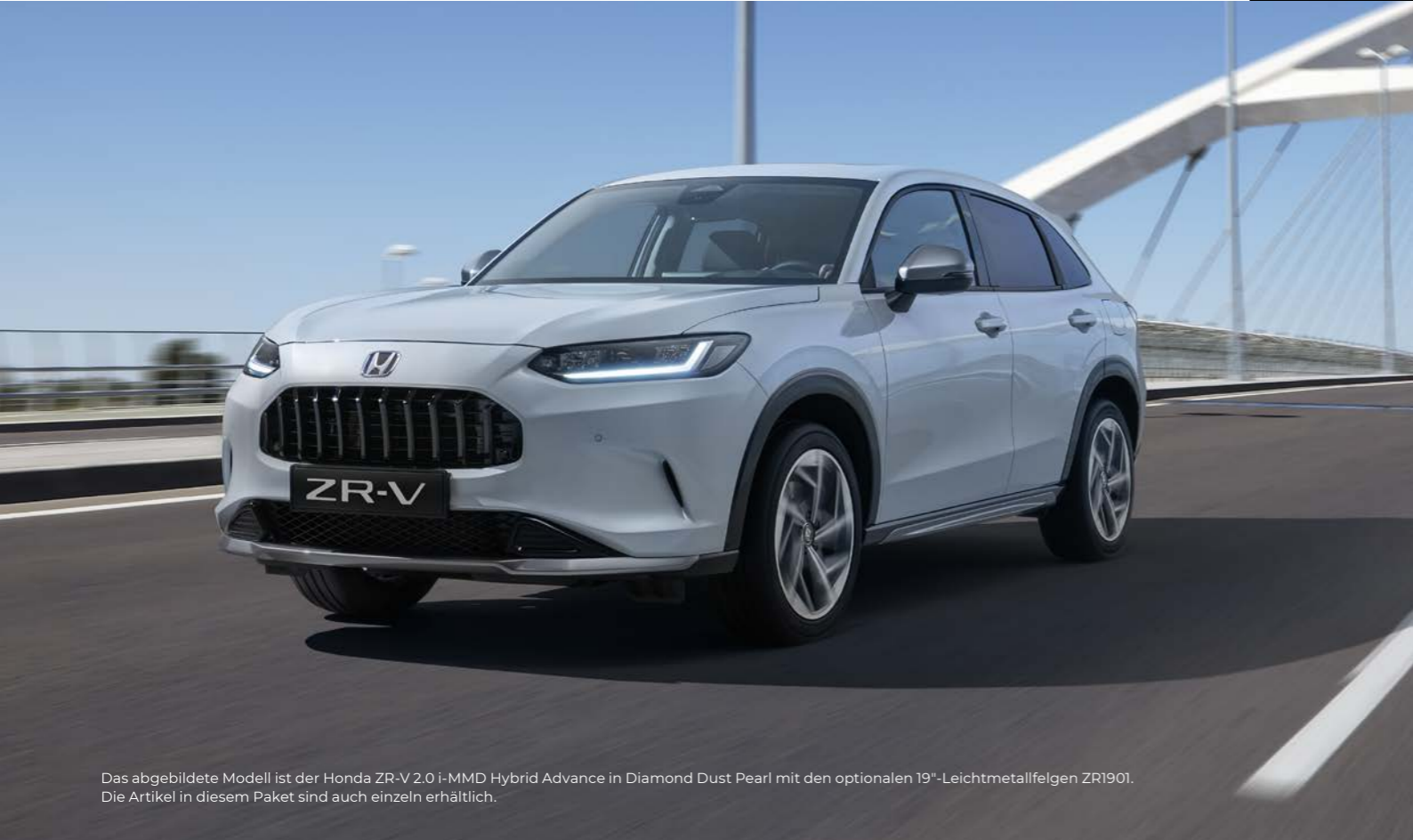
Das abgebildete Modell ist der Honda ZR-V 2.0 i-MMD Hybrid Advance in Diamond Dust Pearl mit den optionalen 19"-Leichtmetallfelgen ZR1901. Die Artikel in diesem Paket sind auch einzeln erhältlich.

Das Aero-Paket wurde speziell dafür entwickelt, den dynamischen Look und das Fahrgefühl des ZR-V weiter zu steigern und zu ergänzen. Das Paket besteht aus einem Aero-Frontstossfänger, einer Heckklappen-Zierblende, Seitenschwellern und Aussenspiegelabdeckungen, alle in Dusk Grau-Metallic lackiert und ergänzt durch einen Heckklappenspoiler in Wagenfarbe.