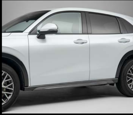
SEITENSCHWELLER Verleihen Sie Ihrem ZR-V mit diesen eleganten und schnittigen Seitenschwellern ein aufregendes und athletisches Profil.