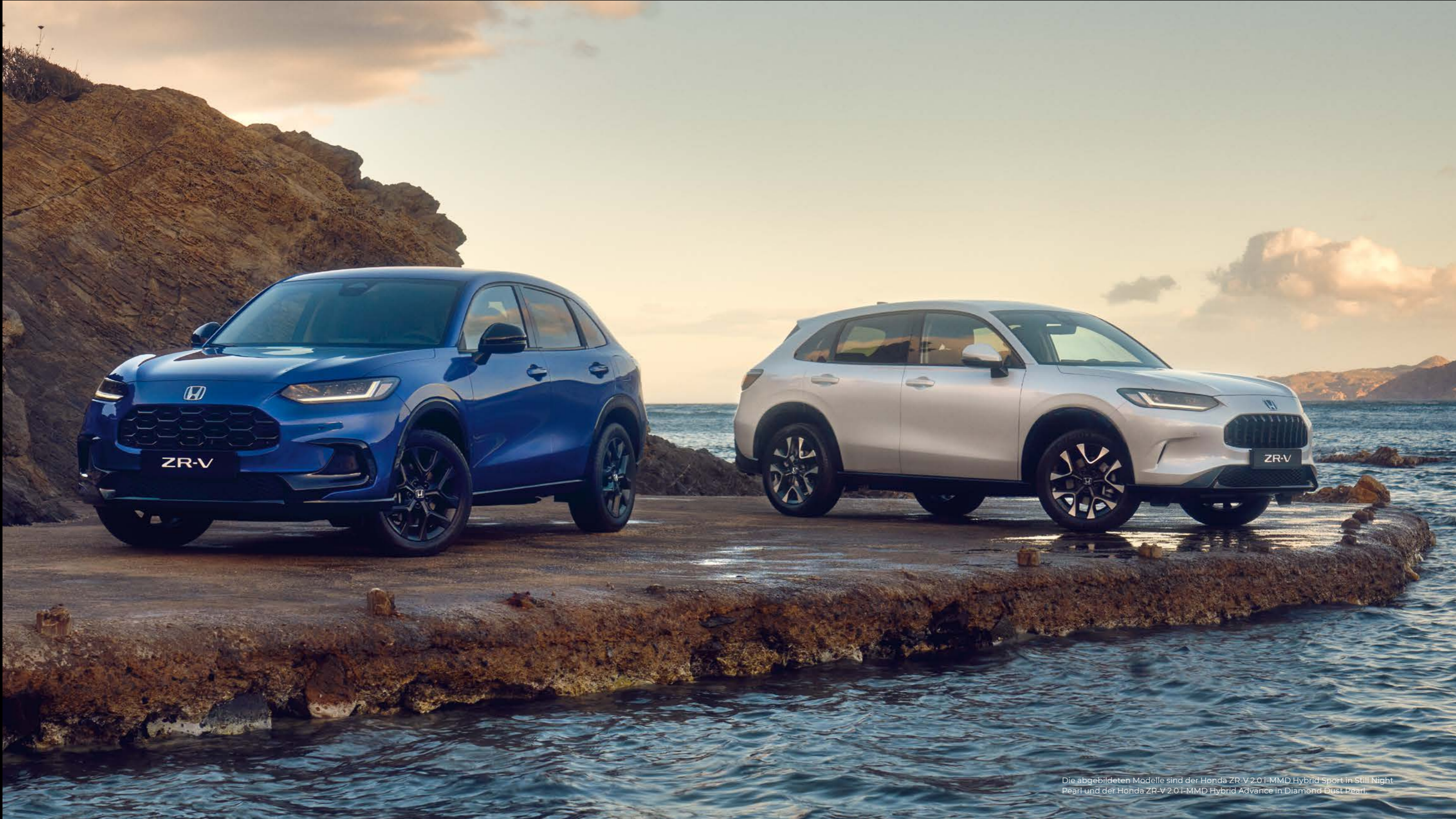
Die abgebildeten Modelle sind der Honda ZR-V 2.0 I-MMD Hybrid Sport in Still Night Pearl und der Honda ZR-V 2.0 I-MMD Hybrid Advance in Diamond Dust Pearl.