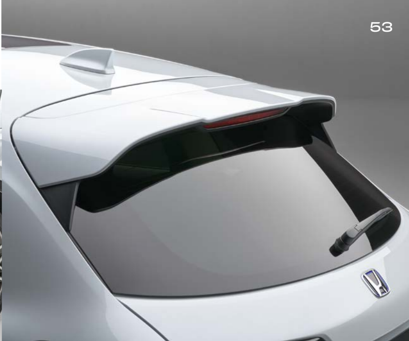
HECKKLAPPENSPOILER Der Heckklappenspoiler in Karosseriefarbe verlängert den eleganten Bogen des Dachs und betont den sportlichen Look.