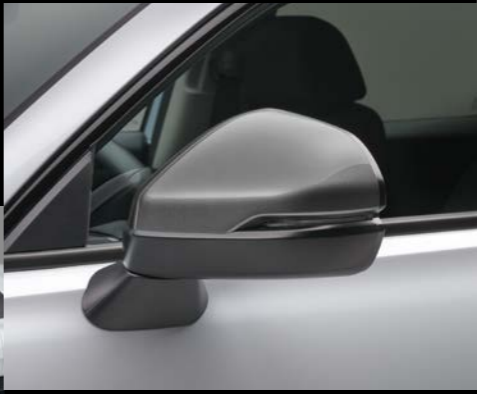
AUSSENSPIEGELVERKLEIDUNGEN Machen Sie Ihren ZR-V noch individueller mit diesen eleganten Aussenspiegelabdeckungen, die sich nahtlos in das Design Ihres ZR-V einfügen.