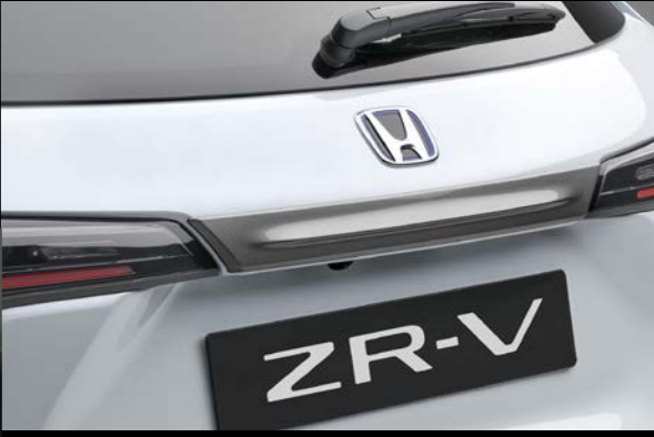
HECKKLAPPEN-ZIERBLENDE Unterstreichen Sie den wertigen Look Ihres Autos mit dieser attraktiven Heckklappen-Zierblende.