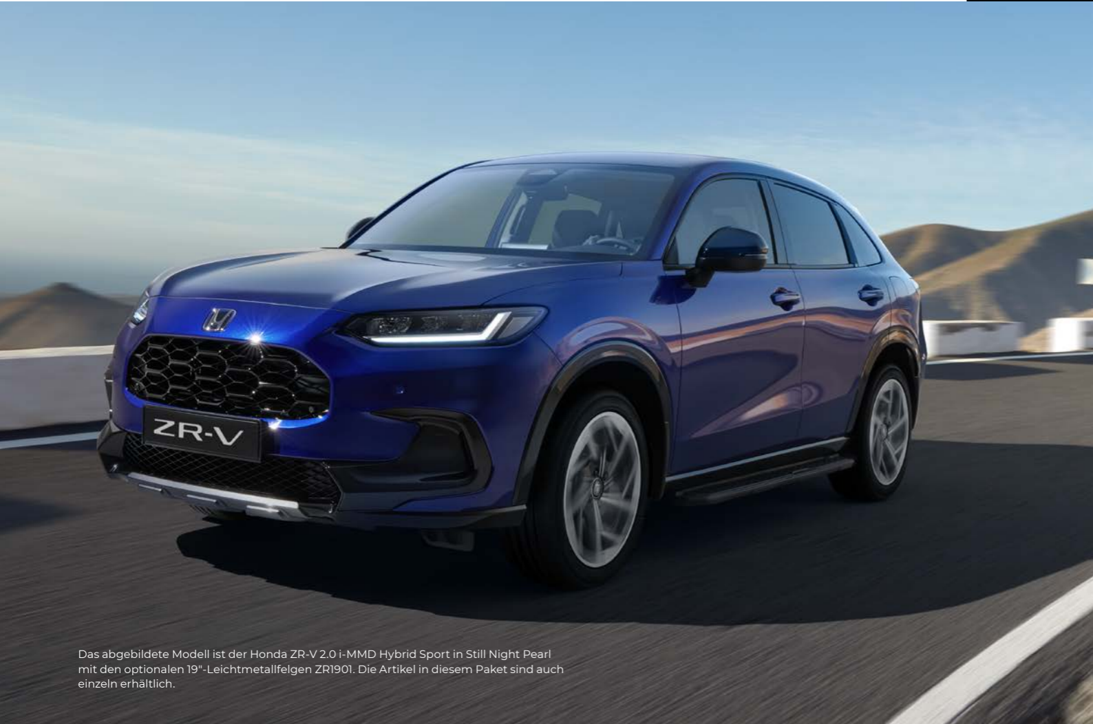
Das abgebildete Modell ist der Honda ZR-V 2.0 i-MMD Hybrid Sport in Still Night Pearl mit den optionalen 19" Leichtmetallfelgen ZR1901. Die Artikel in diesem Paket sind auch einzeln erhältlich.

Der Name spricht für sich – es ist das perfekte Paket für Abenteuerlustige, die lieber die landschaftlich reizvolle Route nehmen. Das Paket besteht aus einer unteren Frontverkleidung und einer Heckklappen-Zierblende, beide in Dusk Grau-Metallic, sowie Trittbrettern und Schmutzfängern.