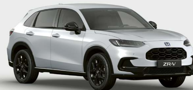
PLATINUM WEISS PEARL